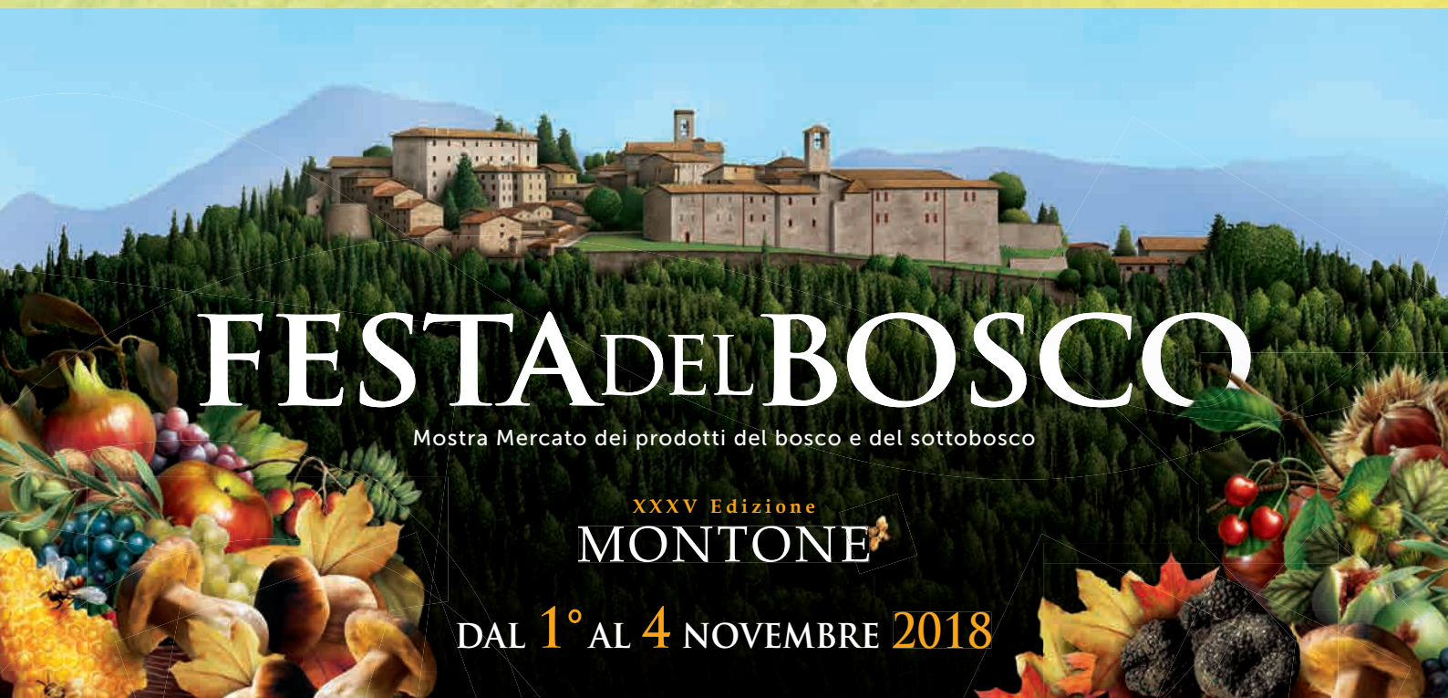
Immagine creata da BILUMI/2008